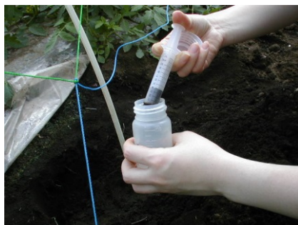
②土壌試料5mlをポリ瓶に入れる