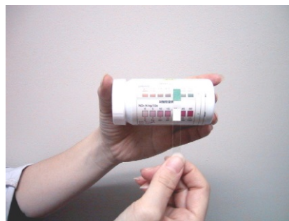
⑤一定時間経過後に試験紙の色を測定する