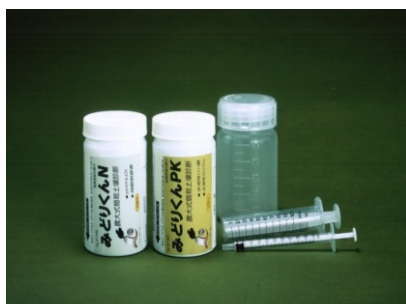
「みどりくん」スターターキット