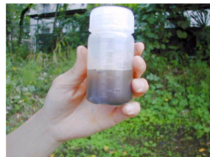
③精製水を50mlまでくわえる