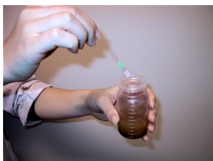
④1分間振とう後、発色させる