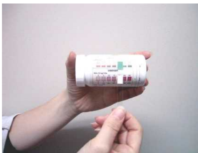
⑤一定時間経過後に試験紙の色を測定する