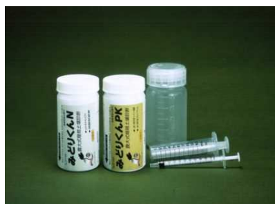
「みどりくん」スターターキット