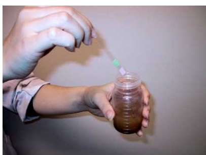
④1分間振とう後、発色させる