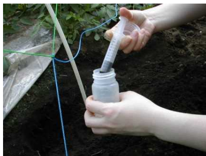
②土壌試料5mlをポリ瓶に入れる