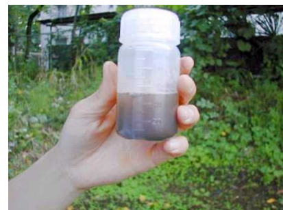
③精製水を50mlまでくわえる